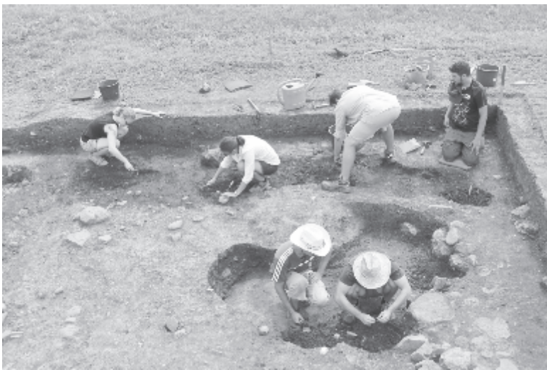
Kutatóárok a parancsnoki épületnél