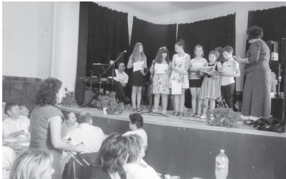
Vasárnap mutatták be a tehetségeket